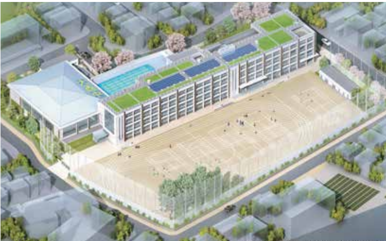
練馬区立大泉西中学校舎等改築工事（完成イメージ）

区は、小中学校の建物を70年持たせる方針に変わり、今後地域の皆さんも大事に思って下さることをお願いする次第です。因みに、基本設計から、今年度までの費用は、新しく整える机等を含めて、47億1千万円要しました。